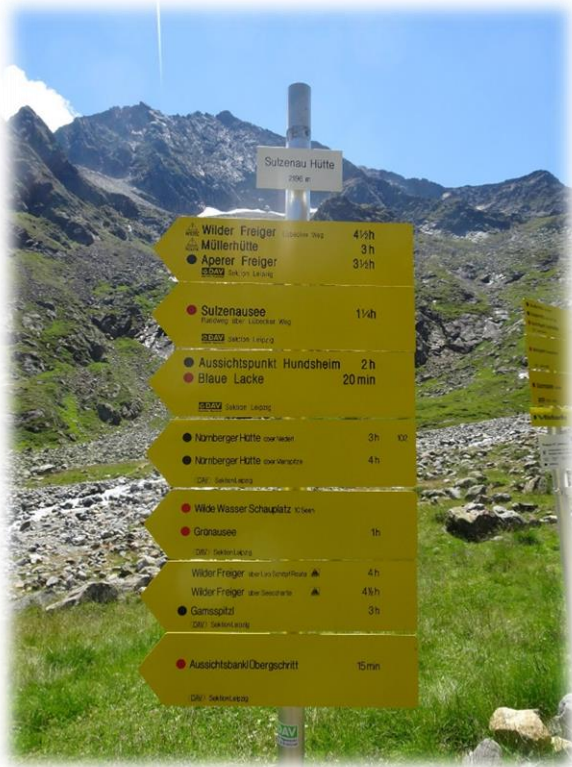
Christof op weg naar een frisse duik in het blauwe meer dat zowat een honderdtal meter boven de Sulzenauhutte gelegen is.