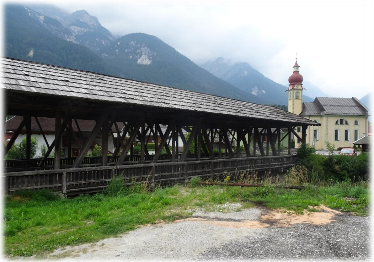
De overdekte houten brug over de Ruetz in Madraz is in 1937 gebouwd naar een ouder model.