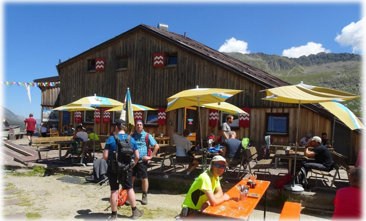
De Sulzenauhutte torent majestueus uit boven het keteldal van de Sulzenaualm op 2191 m en werd voor het eerst gebouwd in 1926 te midden van dennenvelden, bergweiden en kristalheldere bergmeren.