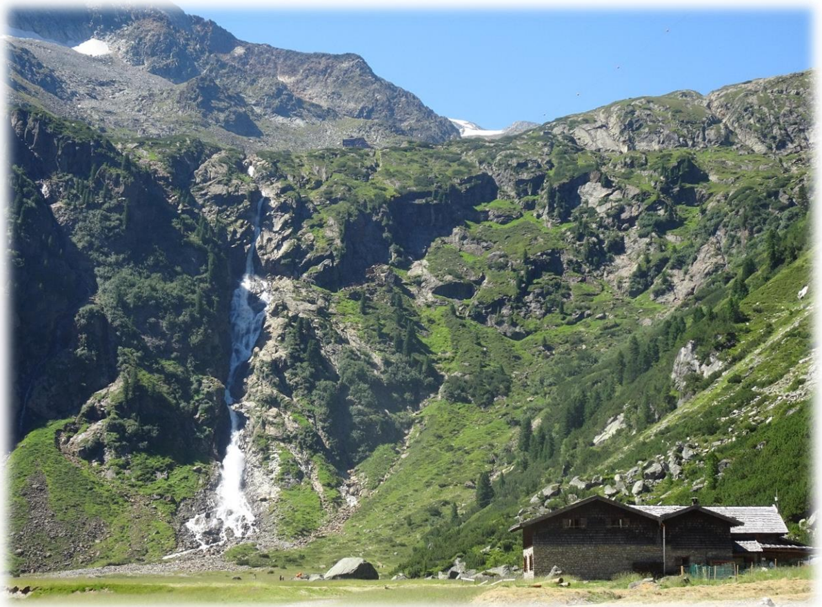
In de verte zien we al de Sulzenau waterval over een hoogte van 200 meter naar beneden vallen.